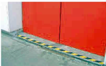
Escalones en salidas de emergencia